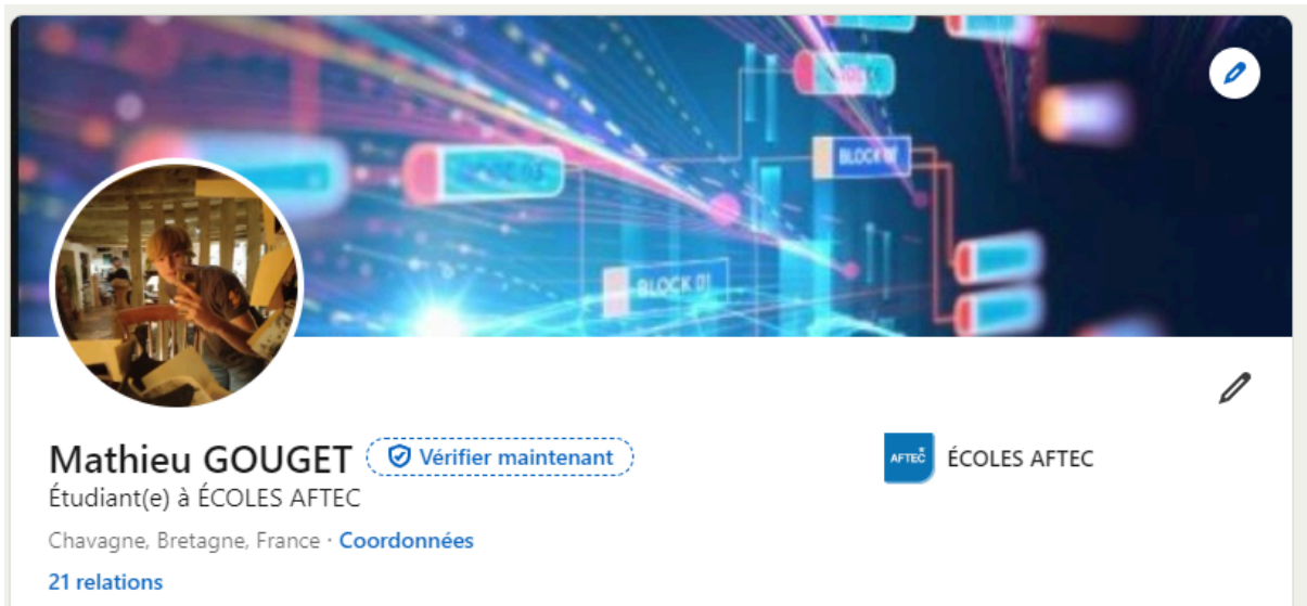
Fig. 4 - Profil LinkedIn