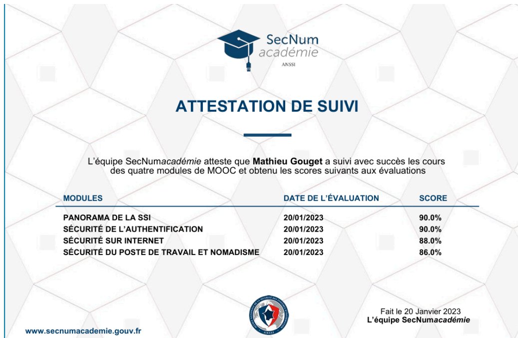
Fig. 1 - Certificat ANSI